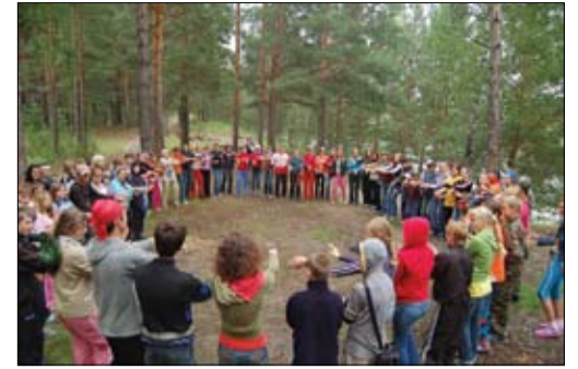
Новосибирская область, 2007 год

Результат экспедиции превзошел все наши ожидания. Почти все школы начали претворять свои проекты в жизнь той же осенью. Первые посадки они самостоятельно организовали в конце сентября 2007 года, во время областной акции «Неделя Рязанского леса». Все акции прошли успешно. А некоторые свежеспеченные «инструкторы» даже ходили лично (без учителей!) согласовывать территорию, выбранную для посадки леса, к директорам сельхозпредприятий.